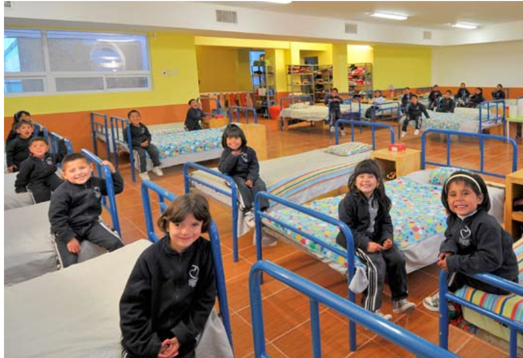
Asilo de Niños y Casa Hogar I.B.P. Chihuahua, Chih.

Con el respaldo y compromiso de este equipo de trabajo, logramos brindar un servicio rápido y eficiente a las instituciones beneficiarias.