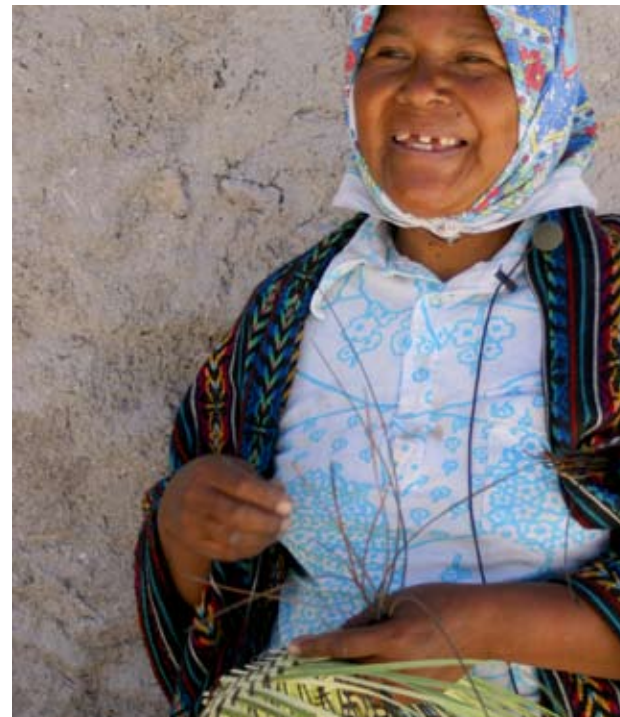
Centro de Trueque. San Luis de Majimachi, Chih.

"Yo cambio mi ware por maseca, sal, azúcar... aquí el dinero no rinde por eso se me hace muy bueno el centro, es muy buena ayuda".