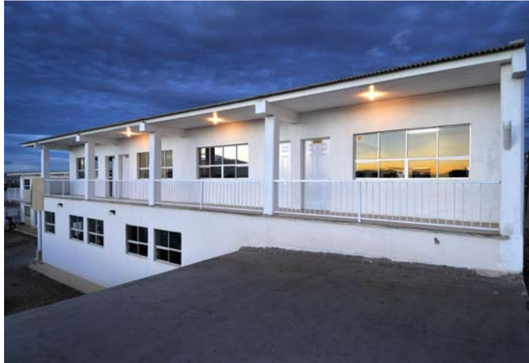
Centro Comunitario San Francisco de Asís. A.C. Cuauhtémoc, Chih.

Brinda atención a 2,850 niños, jóvenes y adultos ofreciendo talleres de orientación familiar, clases de pintura, manualidades, consultorio médico, educación secundaria para adultos y capacitación en oficios diversos.