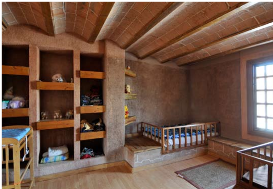
Albergue "Los ojos de Dios". Juárez, Chih.

"Aquí es la casa de los niños, que son huérfanos y con alguna discapacidad. Poderle cambiar la vida aunque sea a un sólo niño hace que el esfuerzo de todos valga la pena."