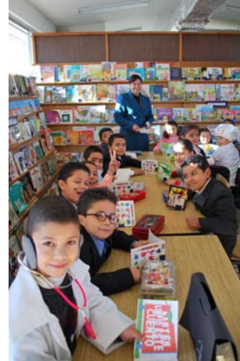
Escuela Primaria No. 130 Rosales, Chih.

“El programa EDUCA nos ha ayudado a organizar mejor nuestro trabajo, a enseñar a los maestros a hacer su plan y a salir adelante con los problemas que tenemos ahorita en educación”.