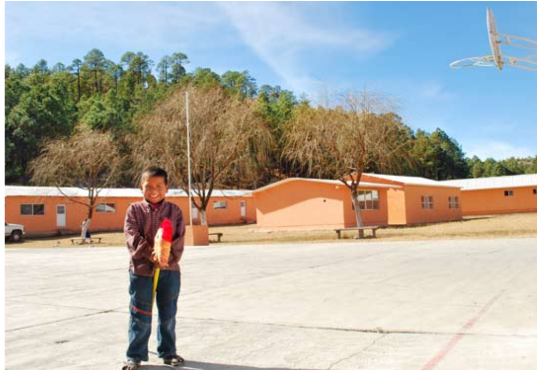
Albergue Escolar. Hueleyvo, Chih.

Incluye la ampliación, reconstrucción, remodelación y creación de nuevos y mejores espacios educativos.