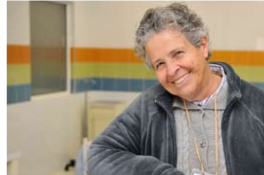
Un ciudadano polivalente, responsable y con identidad. Jiménez, Chih.